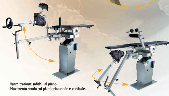
Barre trazione solidali al piano. Movimento snodo sui piani orizzontale e verticale.

TAVOLO TRAUMATOLOGICO UNA SCELTA VINCENTE PER LE SALE PIÙ MODERNE.