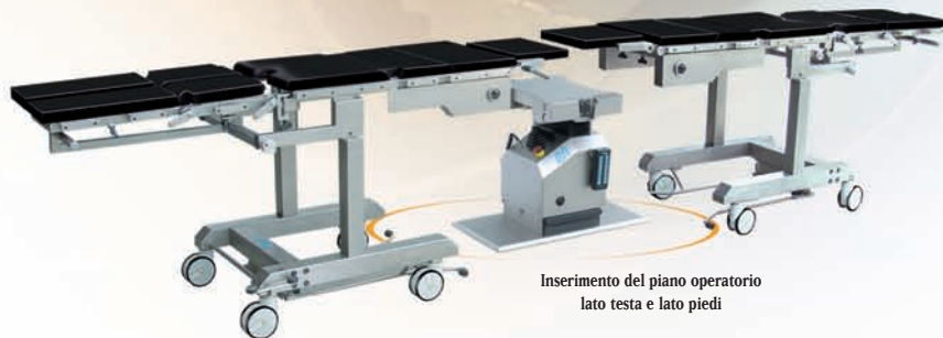
Inserimento del piano operatorio lato testa e lato piedi